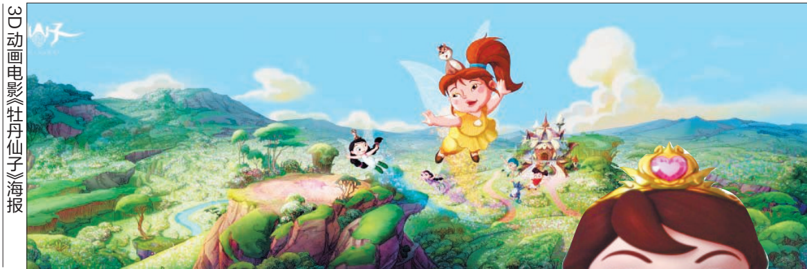
3D动画电影《牡丹仙子》海报