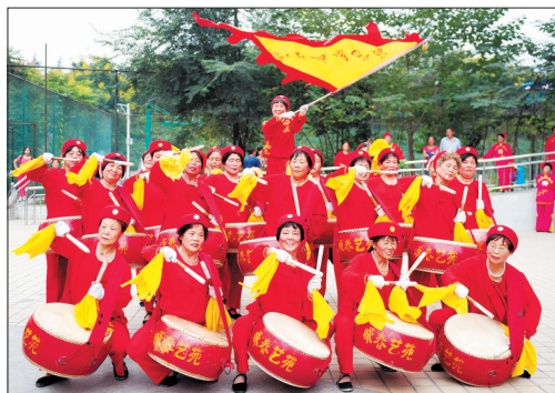
气势磅礴的盘鼓表演