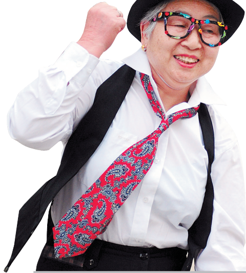
活力四射的老年街舞