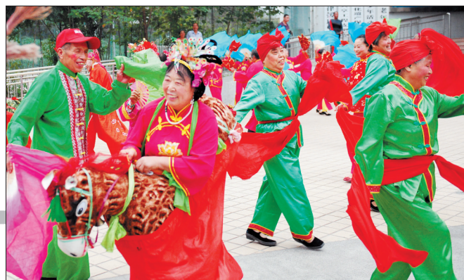
最具喜感的东北大秧歌