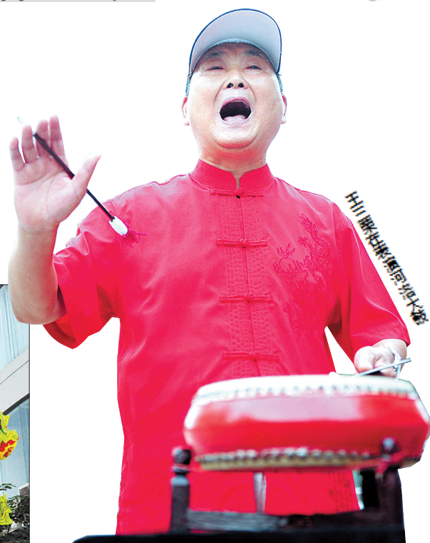
H11 睢县舞狮队表演大鼓