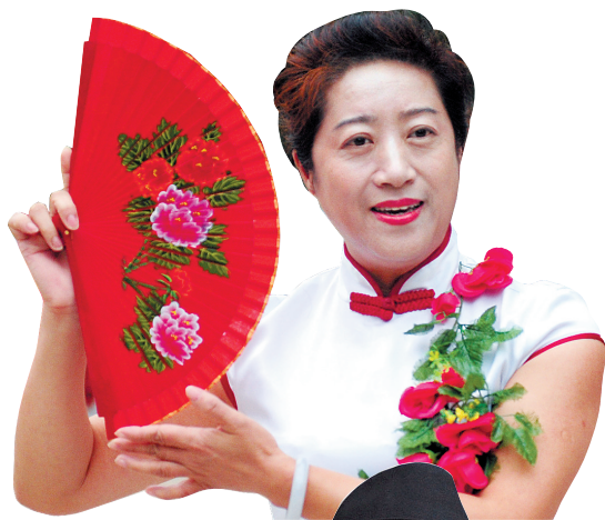
精彩的京剧《梨园颂》选段