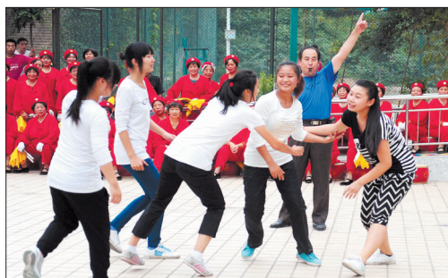
神秘的卡巴迪表演