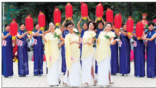
让人惊艳的老年模特表演