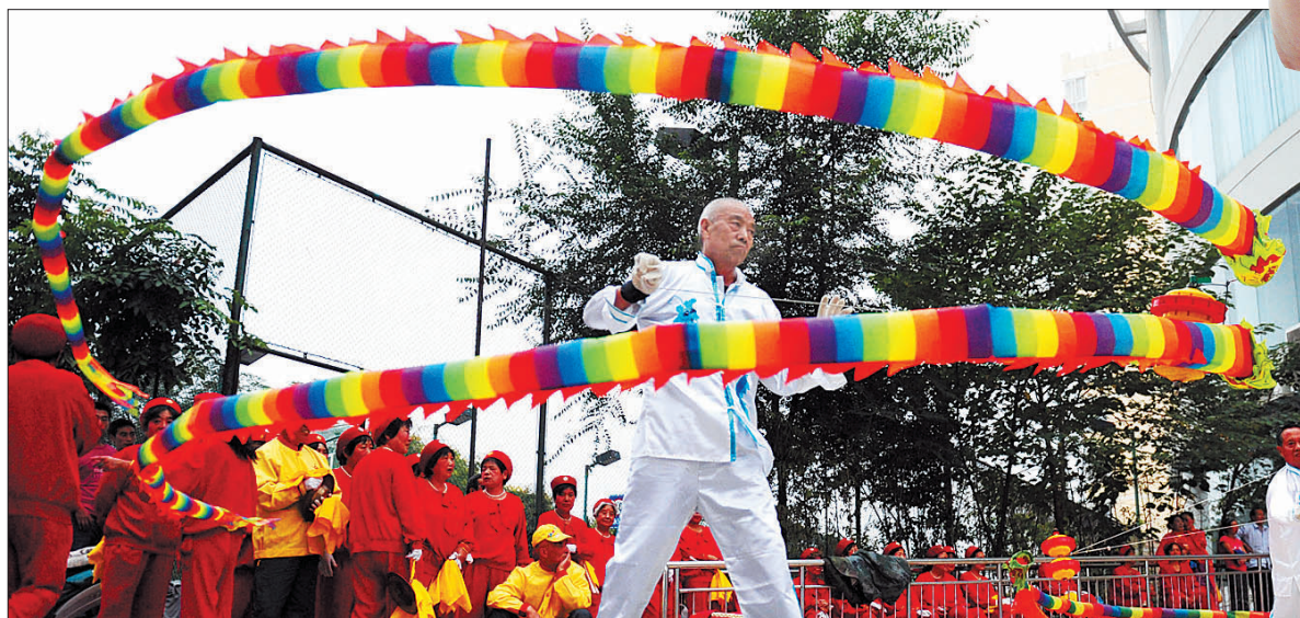
令人眼花缭乱的抖空竹表演