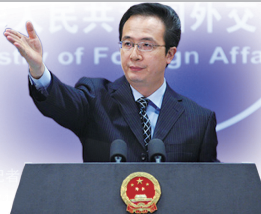
洪磊在主持例行记者会。(据外交部网站)

外交部发言人洪磊24日在例行记者会上说,应日方要求,中方同意日本常务副外长相周夫于9月24日至25日来华,同外交部副部长张志军就当前中日关系特别是钓鱼岛问题举行磋商。洪磊表示,中方将在磋商中阐明在钓鱼岛问题上的严正立场,要求日方纠正错误,为改善中日关系作出应有努力。