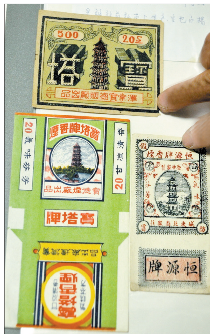
解放前私营厂生产的宝塔牌香烟