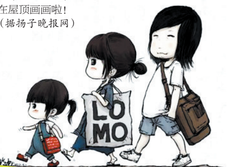
木朵爸爸笔下的一家三口

非常网闻 洛阳蟹都汇 特约 西工总店：62209326 涧西旗舰店：涧西区银川南路 (洛阳大酒店北200米) 电话：65115222