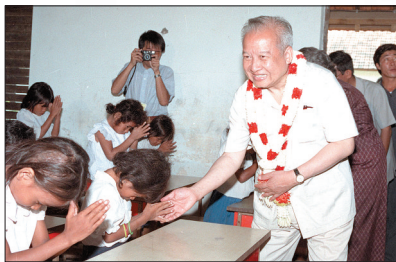
这是1991年11月18日,诺罗敦·西哈努克到金边第一玫瑰孤儿院参观的资料照片。