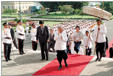
这是1993年9月24日,诺罗敦·西哈努克(前)参加签署王国宪法仪式,并宣布柬埔寨王国成立的资料照片。