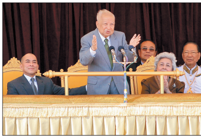
这是2011年10月30日,在柬埔寨金边,诺罗敦·西哈努克(前中)在寿辰庆祝集会上致辞的资料照片。

同日,全国人大常委会委员长吴邦国、国务院总理温家宝、全国政协主席贾庆林分别向柬埔寨参议院主席谢辛、国会主席韩桑林、首相洪森致唁电。温家宝当晚前往柬埔寨太皇西哈努克生前在北京的住所,看望柬埔寨太后莫尼列和国王西哈莫尼,对西哈努克太皇不幸病逝向他们表示沉痛哀悼。国家副主席习近平当天在北京看望了柬埔寨太后莫尼列,对柬埔寨太皇西哈努克逝世表示哀悼和慰问。