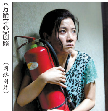
□新华社北京10月18日电 (记者 白薇 王小鹏)