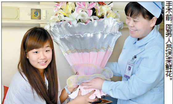
手术前 医务人员送鲜花。

面的书籍。他现在的愿望就是等媚捷身体恢复后，找一份适合的工作踏踏实实地干，做一个对社会有用的人。