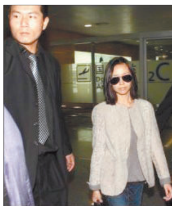
21日,董洁在上海现身,墨镜遮面,一言不发。