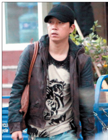
几天前,潘粤明在北京被发现独自外出,面色阴郁。