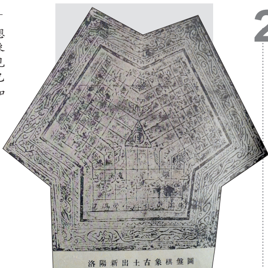
↑《国立北平图书馆馆刊》刊登的“洛阳新出土古象棋盘图”