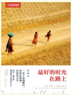
最好的时光在路上

作者:郭子鹰 出版社:中国大百科全书出版社 旅行,能让你遇到那个更好的自己。目的地,永远不会是一个地点,而是一个新的视角。《最好的时光在路上》完美展现了光与影的协调所带来的精神涤荡和他乡客旅对自由灵魂的追求及向往。郭子鹰笔下和镜头中的斯里兰卡,纯真、温暖、艳丽,散发着迷人的热带异域之光彩。