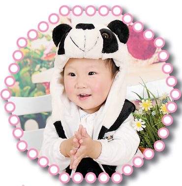
姓名:狄艺宸 性别:女 生日:2010年9月26日 父母寄语:祝宝贝健康康、聪明伶俐,开心度过每一天。

该项研究负责人普莱斯博士表示,新研究涉及的是年龄7个月以上的宝宝。一些专家认为,如果年龄不足7个月的宝宝,还是要立即安抚。(陈希)