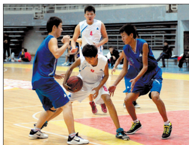
昨日的比赛场面

昨日，在市第二实验中学(新区)体育馆赛区进行的男子乙组(U12)比赛中，洛阳队以69:46轻松战胜济源队。