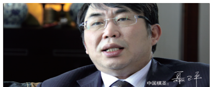
“美丽岛老花镜,看远看近只需一副,方便舒适不用换,真好!”

【品牌动态】“美丽岛杯将军团诗词书画品鉴会”在京落幕,会上人们盛赞美丽岛老花镜。详见: www.milido.cn