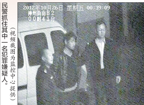
民警抓住其中一名犯罪嫌疑人。