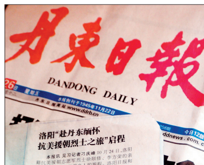
26日,《丹东日报》对缅怀之旅进行了报道。

这几天,由洛阳日报报业集团组织,西工区农村信用联社主办,河科大一附院协办的“赴东北缅怀抗美援朝烈士之旅”活动,在所经的锦州、沈阳、丹东等地引发关注,并持续升温。