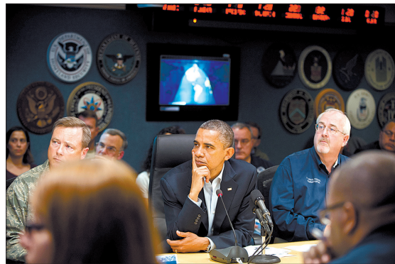
二十八日,奥巴马(中)在首都华盛顿参加联邦紧急措施署举行的关于应对飓风“桑迪”的会议。

2005年,“卡特里娜”飓风肆虐美国南部,时任总统乔治·W·布什应对灾害不力,饱受批评。美联社评述,这场风暴给予奥巴马展现领导能力的机会,然而,如果救灾不力,民众将归咎于联邦政府,总统将承担责任。