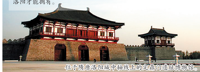
位于隋唐洛阳城中轴线上的定鼎门遗址博物馆。

如今走在定鼎路上，拔地而起的隋唐建筑常让人恍如隔世，挺拔的明堂、伟岸的宫墙，让穿行其中的人们感受到盛世繁华。这些，只有生活在十三朝古都的洛阳人才能感受，因为这些，只有洛阳才能拥有。