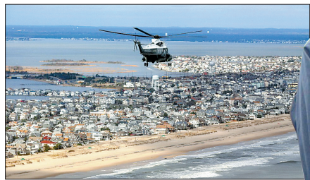
奥巴马乘坐直升机视察灾区。