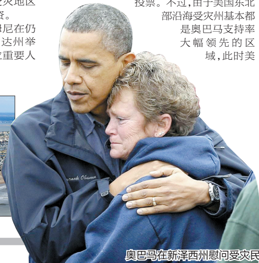
奥巴马在新泽西州慰问受灾民众。