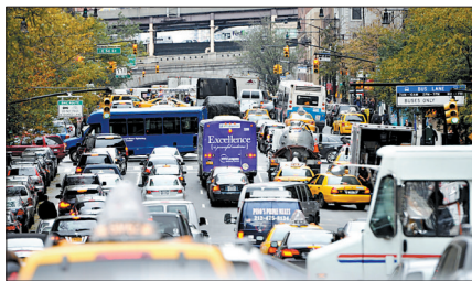
10月31日,车辆拥堵在纽约曼哈顿第一大道。

除了沿海的重灾区,飓风在宾夕法尼亚和俄亥俄这样的选战胶着地区也造成了相当的影响。竞选电视广告被迫停播,改为滚动播报灾情,而在一些地区,提前投票也被取消。另外,断电和基础设施受损,也肯定会对投票结果产生影响。在大选投票日临近之际,任何突发事件都可能打破双方支持率微妙而脆弱的平衡,这类事件被称作“十月惊奇”,而飓风“桑迪”正符合这个条件。