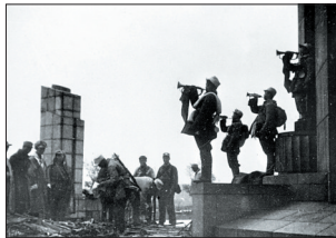
我军司号员吹响胜利的号角。(资料照片)

▶1948年11月2日,解放战争三大战役之一的辽沈战役胜利结束。辽沈战役历时52天,共歼灭国民党军47万余人,东北全境获得解放。