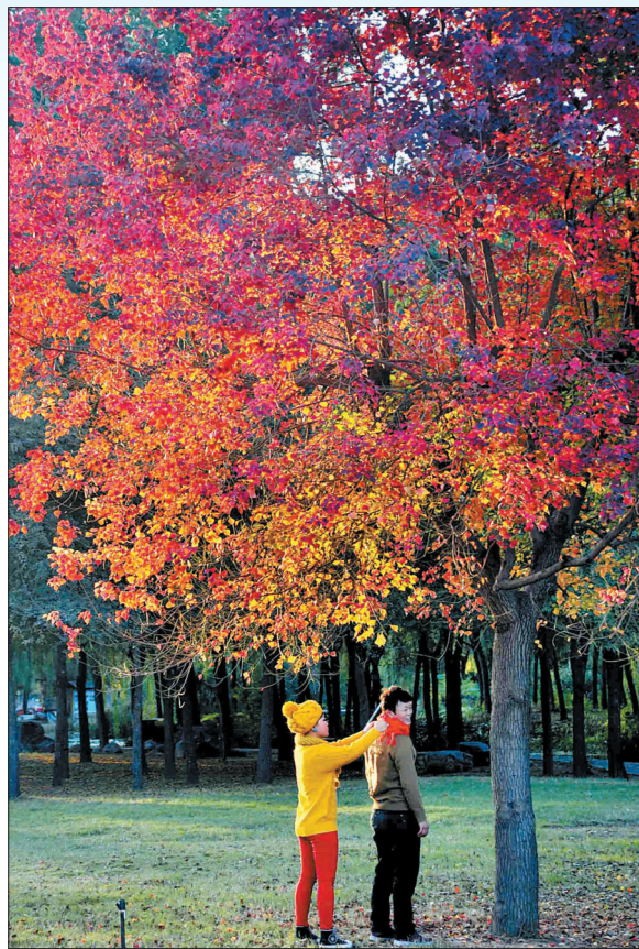
隋唐城遗址植物园里,美景如画。

市农林科学院蔬菜研究所的试验田位于洛龙区安乐镇赵村,从龙门大道与古城路交叉口以北500米,龙门大道东侧的一条小路向东走1000米即到,也可以乘坐15路、33路、55路、57路、58路、65路、66路、69路、76路、81路公交车,到赵村站下车。详情可拨打13592036551、13849963538。