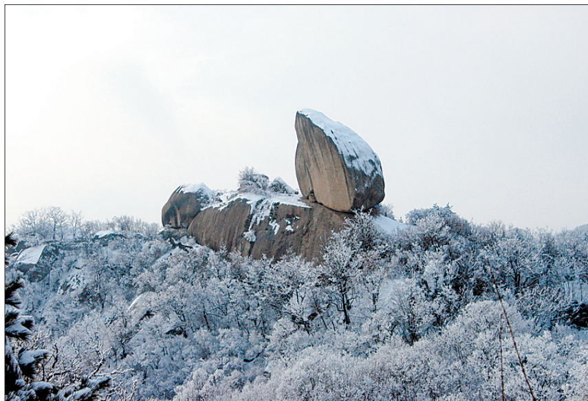
天池山景区“伟人卧像”周围的雪景。通讯员 焦兵 摄