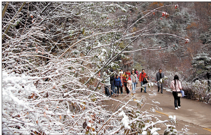
景区如画,游人也成了画中景。