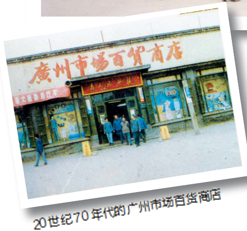
20世纪70年代的广州市场百货商店