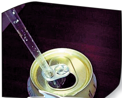
一品玉:易拉罐拉环的正确用法,你用错了多少年?原来,那个拉环是用来固定吸管的。