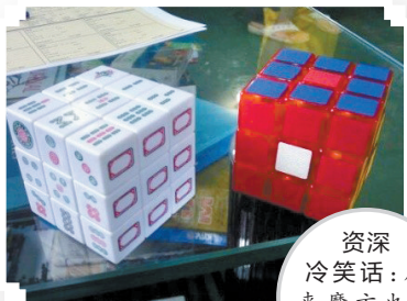
资深冷笑话:原来魔方也有中国版的!