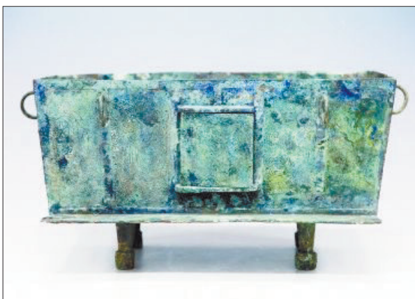
被盗的青铜簋(fǔ,同“腐”音)