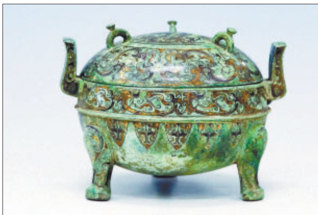
被盗的青铜簋(guǐ,同“鬼”音)

湖北省不久前破获了一起特大盗掘古墓、倒卖文物案,涉案文物数量之多、价值之高,多年罕见。而案件牵出的一个分工明确、利益链条完备的文物黑市,更是触目惊心。