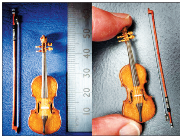
爱德华兹的作品之一。(据中新网)