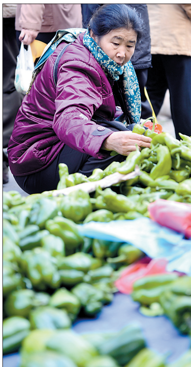
11月9日,市民在长春市花园街早市选购辣椒。

专家们普遍认为,内需的逐步恢复,是中国经济增速小幅反弹的主要拉动力量。PMI等先行指标显示,企业新订单有所增加,企业市场预期好转,原先大规模的去库存基本结束,不少企业开始补充库存、扩大生产,这是短期内影响经济增速的最直接原因。