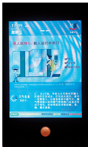
电子屏虽小，信息可不少！