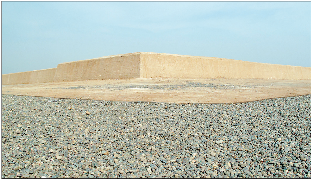
已建成的展示城墙