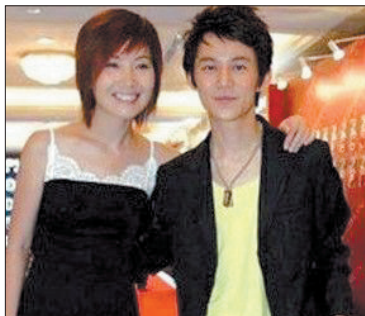
何炅被传辞职引热议

2009年11月13日,投资超2亿美元的好莱坞灾难片《2012》在全球上映;3年后,该片立体3D版将于11月20日起在中国上映。国内发行方中影集团负责人11日在京介绍,此次3D版的视觉重建工作,绝非由2D简单地转制3D。罗兰·艾默里奇早在最初拍摄本片时,就有大量镜头和场景是为3D拍摄而特别设定的,只因当时迫于技术和后期时间的限制,出品方仅推出了2D版本。3D版的视觉重建工作由460人负责,其中包含中国电影股份有限公司带领的中国团队。图为影片海报。