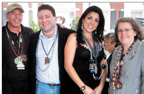
彼得雷乌斯(左)、凯利(右二)和彼得雷乌斯的妻子霍莉(右一)。

“不知道你们是否听说过这件事,在美国驻利比亚班加西领事馆的一栋附属建筑里关押着几个利比亚武装分子,中情局认为领事馆遭袭是因为有人企图救出这些秘密囚犯。”美国有线电视新闻网认为,上述言论表明布罗德韦尔可能掌握了一些不为人知的“国家安全机密”。