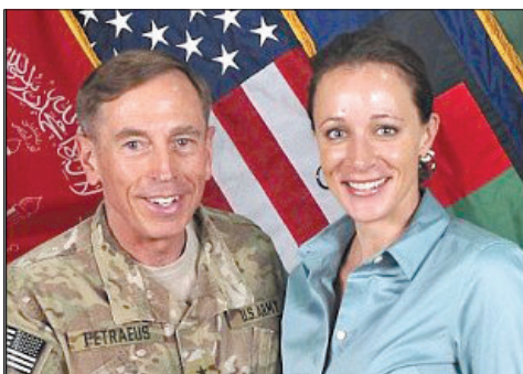
彼得雷乌斯和布罗德韦尔。

此外,美国有线电视新闻网证实,前不久彼得雷乌斯飞往利比亚与当地的中情局驻站站长讨论班加西美国领事馆被袭击事件。本周美国参众两院将就班加西美国领事馆袭击事件举行联合听证会,彼得雷乌斯选择在这个敏感的时间辞职“令人生疑”,一些共和党人也怀疑彼得雷乌斯的辞职与听证会有关。