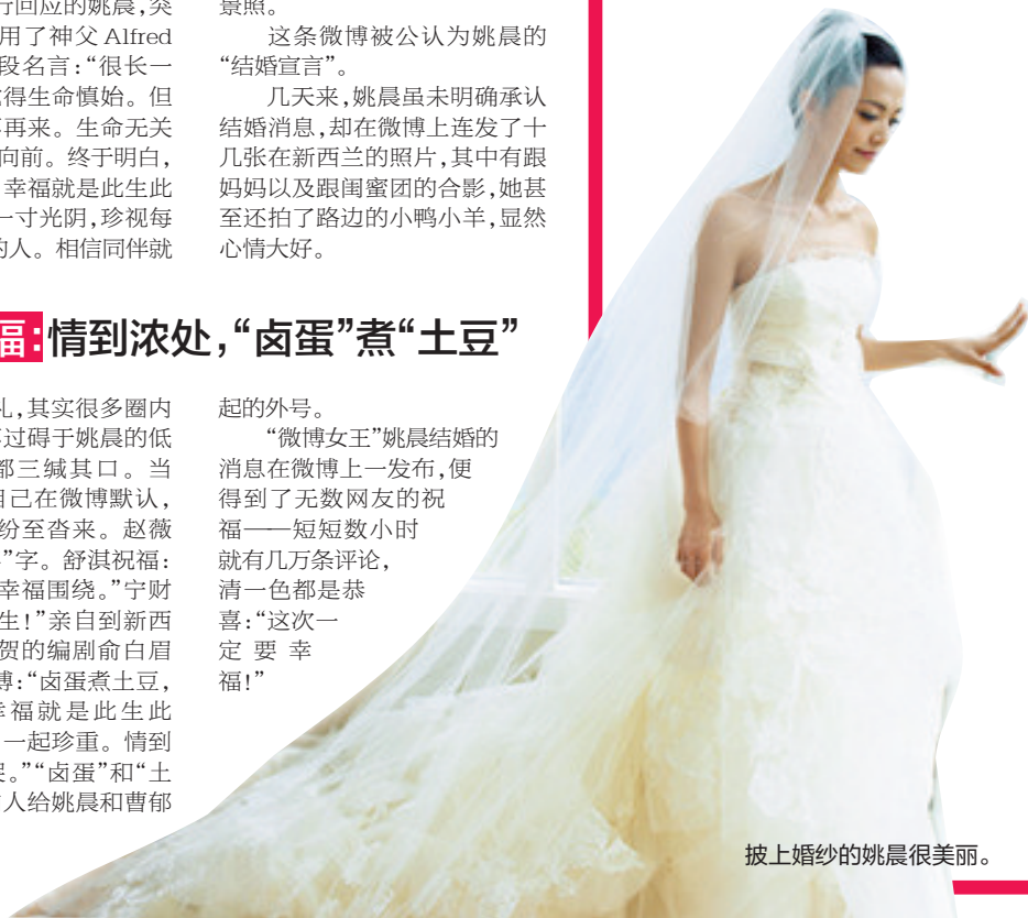
披上婚纱的姚晨很美丽。