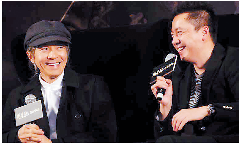
周星驰(左)和王中磊(右)在发布会上

周星驰说,他一直希望拍摄一部属于中国人自己的超级大片,除了丰富的视觉效果和宏大的故事之外,还要有超级的创意和想象,而《西游·降魔篇》正是一个包含以上所有元素的绝佳故事,“妖孽横行的西游世界让影片延续了以往电影中奇诡瑰丽的视觉风格,同时充满一种让人压迫窒息的紧张感。片中随处可见我最擅长的爆笑情节,浪漫感人的爱情故事也是一条重要线索”。