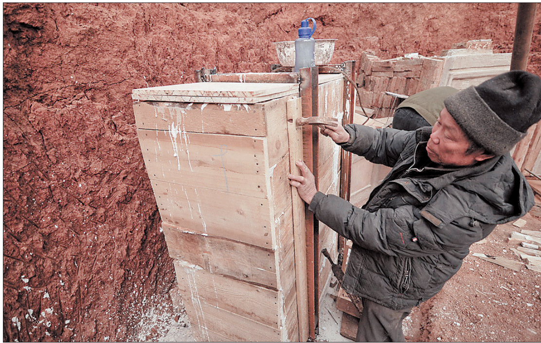
将已经取下的壁画装箱封存。