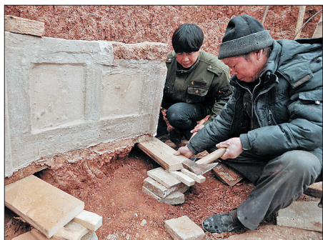
小心翼翼地将木板垫在壁画下方,以便整体搬走。