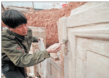
涂抹特制胶水,准备贴纱布。