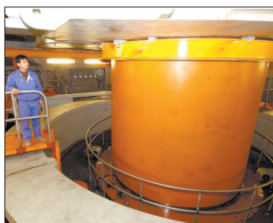
一名技术人员在三峡左岸电站1号机组水车室查看机组运转情况。(2003年11月22日摄)

▶2003年11月22日,长江三峡工程第1号机组正式并网发电并投入商业运行。至此,三峡工程首批发电的6台机组全部投产。