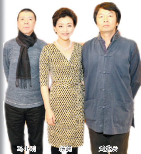
冯小刚 杨澜 刘震云