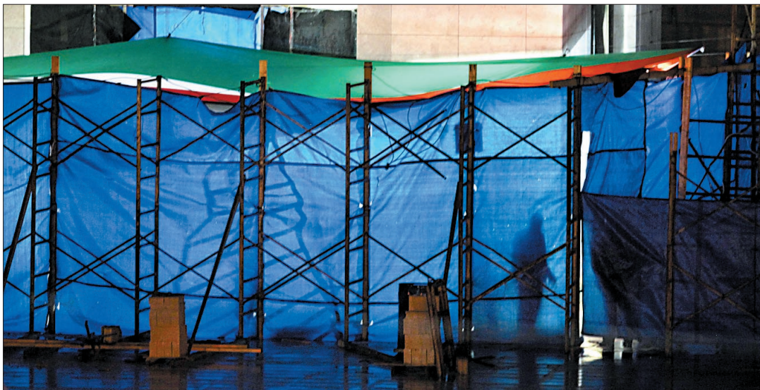
十一月二十六日,在约旦河西岸城市拉姆安拉,一名巴勒斯坦工作人员站在巴已故领导人阿拉法特墓地挖掘现场。