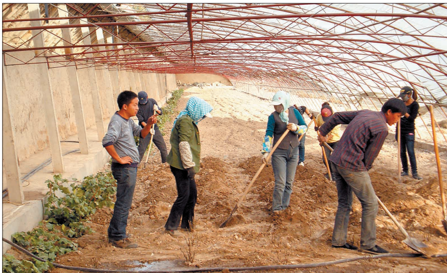
红星一场的工作人员正在栽种牡丹。

提起新疆天山,大家自然会想到天山雪莲,心里也会忍不住打个寒战。李白说“五月天山雪,无花只有寒”。近日,有网友在洛阳网“洛阳社区”上发帖称,经过半年的努力,洛阳牡丹有望在天山脚下开花。那么,在雪莲盛开的地方,适应洛阳温暖气候的牡丹如何生根发芽?我市的牡丹专家又为此付出了怎样的努力呢?