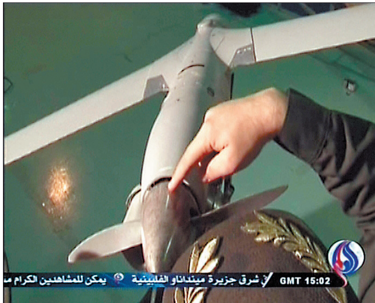
这张伊朗电视台的电视画面截图,展示了伊朗“俘获”的美军无人机(十二月四日摄)。

实相关报道。不过,路透社以一名身在巴林的美国海军中央司令部发言人为消息源报道,美军过去几天没有无人机损失。