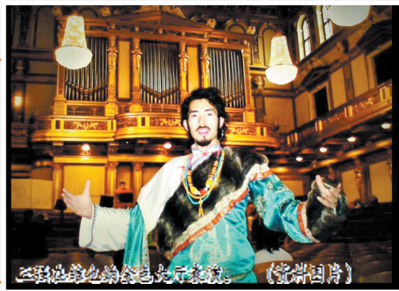
三强在维也纳金色大厅表演。(资料图片)