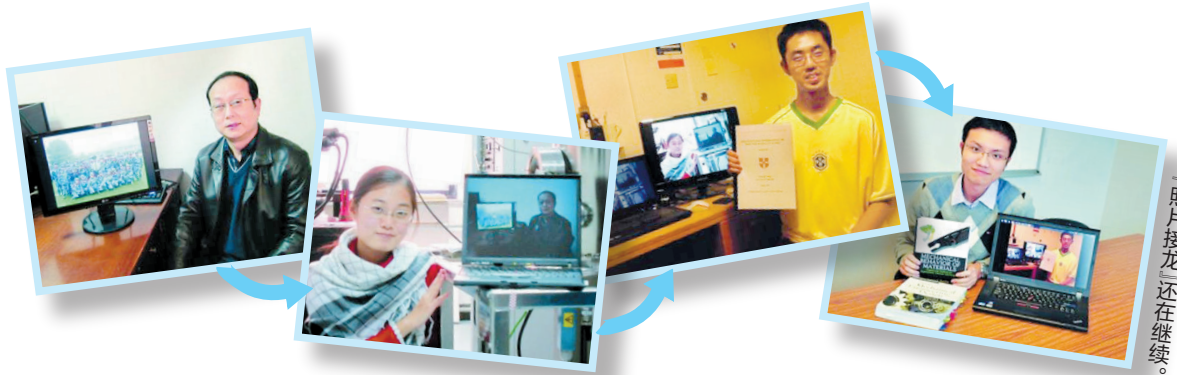
「照片接力」还在继续。

近日，人人网上流传着这样一组充满创意的照片，引起了众多网友的关注。第一张照片是“大家庭”的集体照——在校军训时的青涩合影，然后是班主任与这张照片的合影，随后是学生与前一张照片的合影，以此继续往下传，每一张照片都是下一张照片的道具。这组照片的创意是——“你在我的世界里”，充满了温馨和回忆。