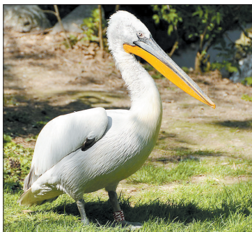
卷羽鹈鹕体型较大，体羽主要为银白色。(资料图片)

随着越冬候鸟抵洛，黄河湿地国家级自然保护区孟津管理局和河南野鸟会的部分鸟友，在孟津县的黄河湿地开展了年度越冬水鸟调查。11日，记者随调查人员来到孟津县的黄河湿地，全天行程60余公里，记录了49种、近3000只鸟，其中包括国家一级保护动物黑鹳(guàn)9只，国家二级保护动物卷羽鹈鹕(tí hú)1只、白琵鹭40余只。