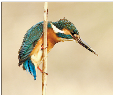
一只普通翠鸟栖息在芦苇上。