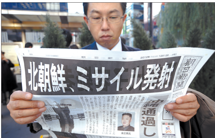
十二月十二日,在日本东京,一名市民阅读朝鲜发射火箭的号外。(新华社发)