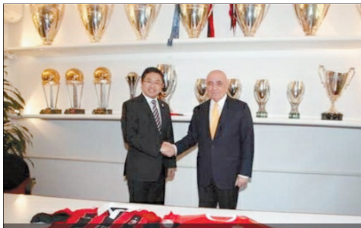
仪式上合影。(网站截图)

和欧洲豪门的“联姻”,在中国足球短暂却崎岖的职业化进程中早不是大姑娘上轿,但最终冷暖自知。如今随着中超球市日益升温,俱乐部掀起新一轮的跨国合作潮,依然个个大牌一团喜气,但合作些什么,合作出了什么成果,还要时间和行动来证明。