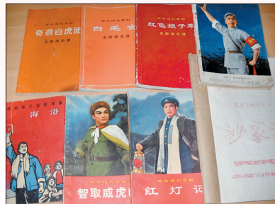
八个样板戏的剧本和曲本