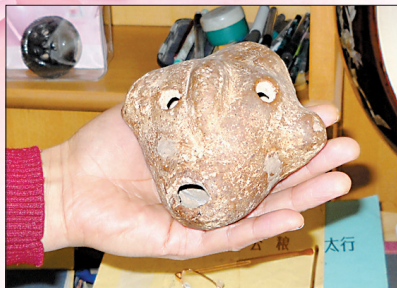
最古老的乐器——古埙