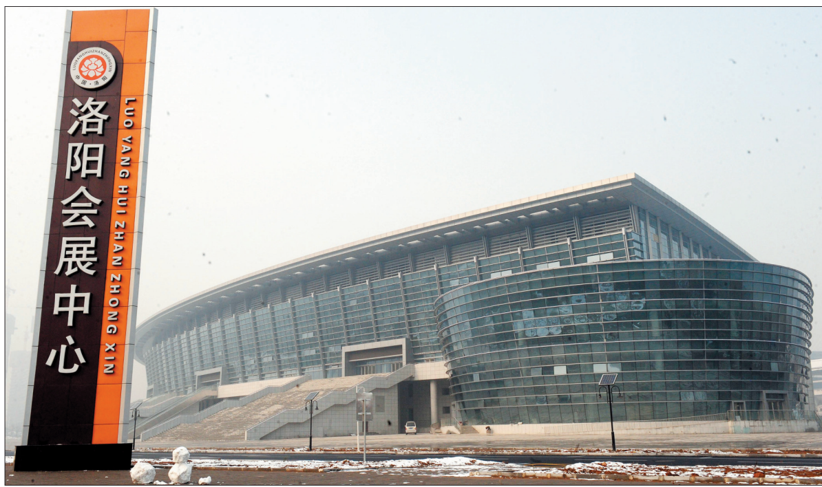
这里是会展中心东侧,从这儿往西走,要走300多米才到会展中心西侧。