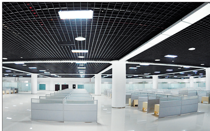
会展中心2楼人才招聘大厅宽敞明亮。

本月底,洛阳会展中心将建成并投入使用。昨日,记者来到位于新区体育公园南部的洛阳会展中心,进入这个巨大建筑内部,提前为大家打探一番。