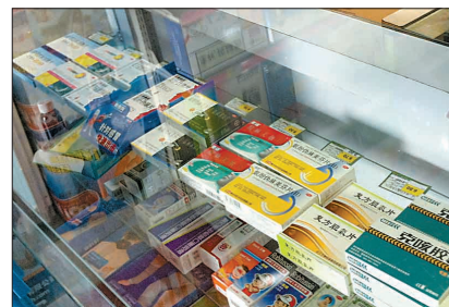
含“麻”感冒药转为处方药，我市各药店均已执行。