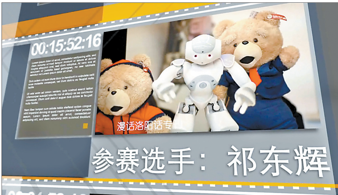
《漫话洛阳话儿》视频截图