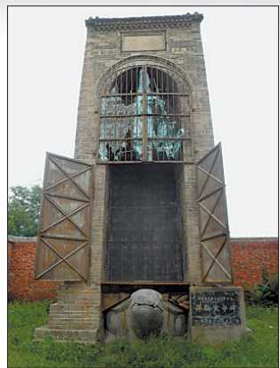
升仙太子碑(资料图片)

作别喜鹊,我转身下山,对太子晋的怀想仍在继续。相传他被废黜后,不能称太子了,但还是王室成员,便改叫王子晋或王子乔,缙氏山也因此成了王姓的发源地之一。诗仙李白说:“吾爱王子晋,得道伊洛滨。”明末清初大书法家、孟津人王铎在《缙岭》一诗中称:“少室石崖岭上通,仙人遗迹未曾空。”我也觉得,太子晋的仙迹仍在,他与缙氏山的故事,还会继续流传下去。