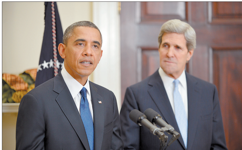
12月21日,美总统奥巴马(左)宣布提名约翰·克里出任下任国务卿。